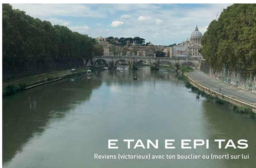
APRÈS LA GUERRE