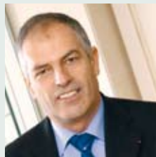
> Jean-Luc BAUCHEREL, Président du Conseil d'administration de Groupama SA

La progression de 15,7% du résultat opérationnel et la baisse de 0,5 point du ratio combiné attestent de l'amélioration des performances du Groupe, fruit des efforts réalisés.